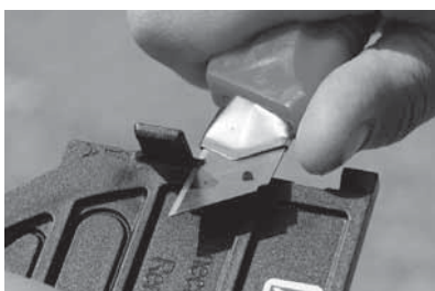
Clip A links en rechts met een mesje afsnijden. De eindplaat vastklikken