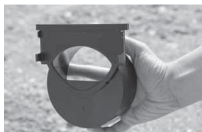
Eindplaat met spie DN 100 voor aansluiting aan Hexaline goot.