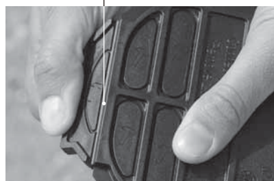
Y-deel afbreken bij de breuklijn.